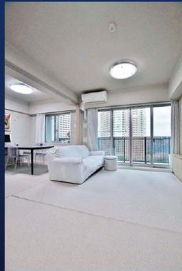
▲リビングダイニング (TES温水式床暖房)