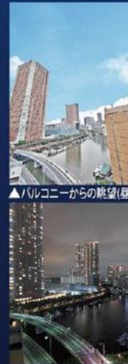
▲バルコニーからの眺望(昼)