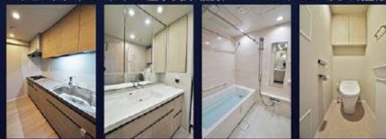
▲キッチン/ディスポージャー付 ▲洗面台/リネン庫付 ▲浴室/フルオートバス ▲タンクレストイレ